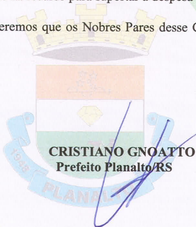
CRISTIANO GNOATTO Prefeito Planalto/RS